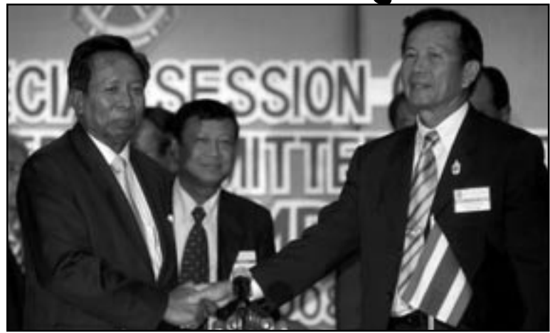
សោក ឆៀវ ធានា ពេលខ្ញុំមកជាមួយមេដឹកនាំស្រុកស្រីស្រី