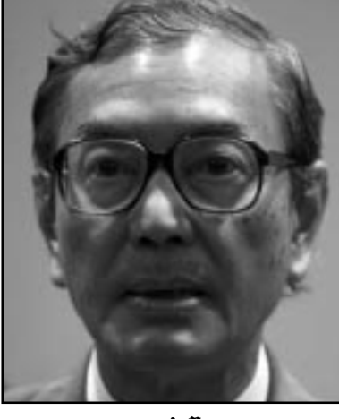
សោក គេ ប៊ុនណារ៉ុន