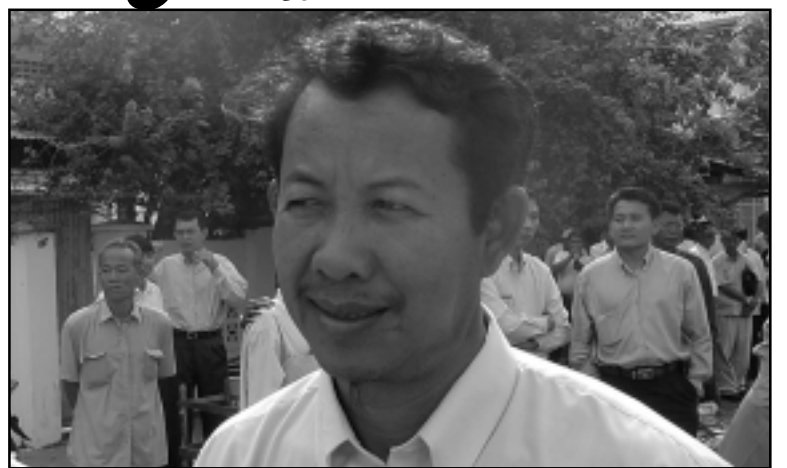
លោក វ៉ុន ឈុន ប្រធានសហភាពសហជីពកម្ពុជា