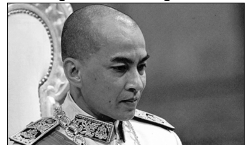
សម្តេចព្រះបរមនាថ នរោត្តម សីហមុនី ព្រះមហាក្សត្រកម្ពុជា