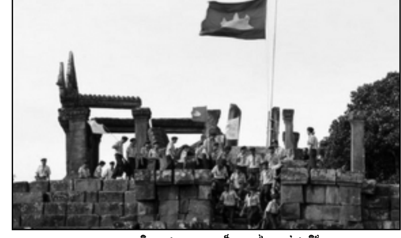
ប្រាសាទព្រះវិហារជ័យអរិយធម៌នៅភ្នំស្រីស្រី