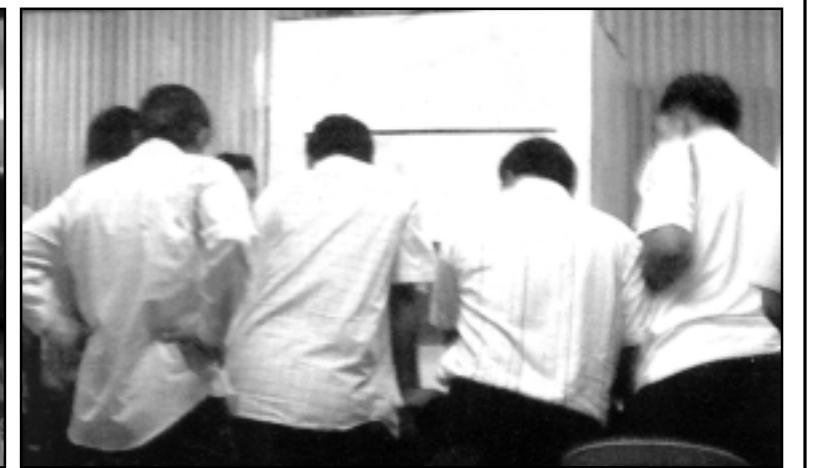
ឧត្តមសេនីយ៍ សៅ សុខា